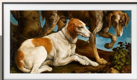
栓在樹墩上的兩隻獵犬（1548） 作者：Jacopo Dal Ponte Bassano