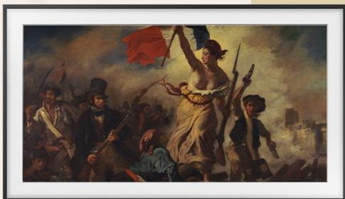
1830 年 7 月 28 日：領導民眾的自由女神（1830） 作者：Eugène Delacroix

採用新古典主義繪畫風格，描繪一段羅馬神話故事。畫中的幾何形狀構圖，增添緊張氛圍。