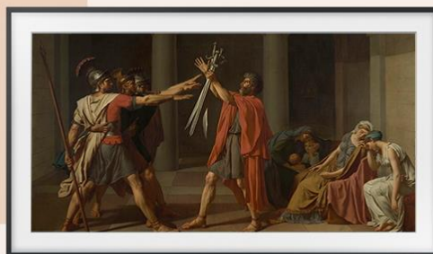
荷拉斯兄弟之誓（1784） 作者：Jacques Louis David

採用新古典主義繪畫風格，描繪一段羅馬神話故事。畫中的幾何形狀構圖，增添緊張氛圍。