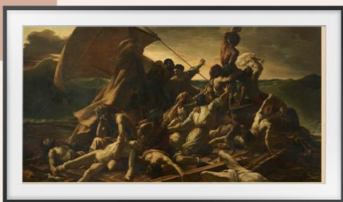
梅杜莎之筏（1819） 作者：Théodore Géricault