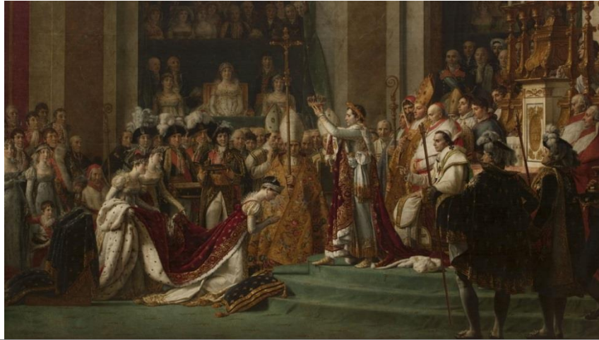
▲ Jacques Louis David 的畫作《拿破崙加冕大典》（Le Sacre de Napoléon · 1806-1807）

三星 The Frame 美學電視持續增加的收錄作品，用戶能隨手拾起歷史長河中的瑰寶，獲得滿滿的靈感啟發。如今，用戶可透過電視內建的藝術市集，欣賞羅浮宮的 40 件藝術創作，以及指標性的建物攝影作品。