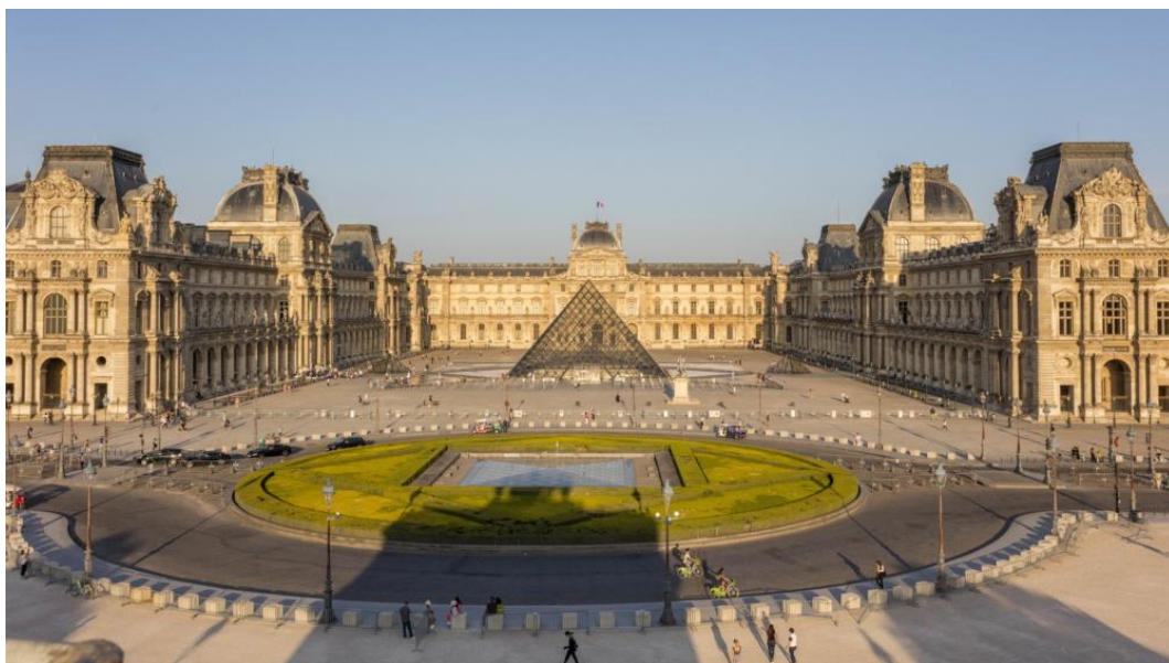
▲ Nicolas Guiraud 的攝影作品《巴黎羅浮宮的金字塔》( Pyramide et Palais du musée du Louvre · 2021 )

三星新聞中心專訪羅浮宮品牌授權發展暨商業合作部門負責人 Yann Le Touher，探索此振奮人心的合作關係將如何造福廣大用戶。