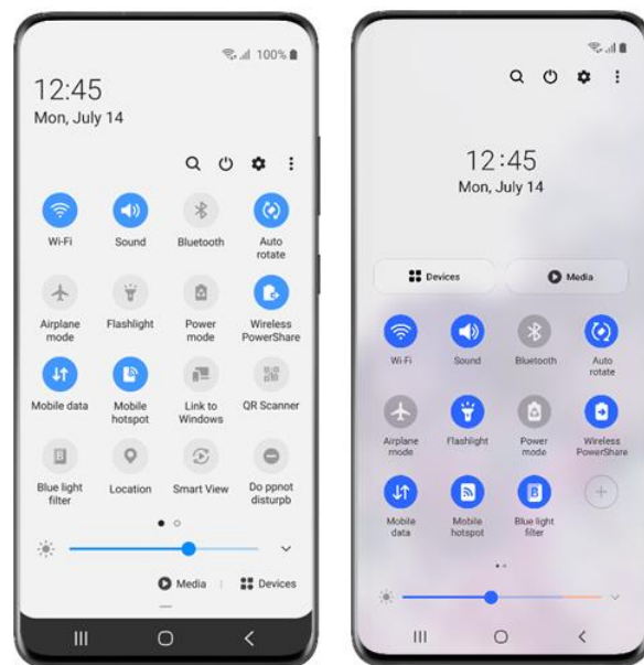
快捷面板優化：One UI 2 ( 左 ) 和 One UI 3 ( 右 ) 二代比較

三星期望使用者能根據個人喜好，量身打造專屬手機介面。現在，不論是經常啟用「深色模式」，亦或分享行動熱點，都能透過簡單的滑動和點擊，以嶄新的方式客製化快捷面板。除了能更輕鬆地分享影像、影片或文件，使用者還可以自行設定分享表單，「釘選」最常用的分享目標，例如聯絡人、通訊應用程式或電子郵件。此外，One UI 還能讓使用者公私分明，劃分職場和私人生活圈資料 (註五) ，減少誤傳資訊的尷尬。