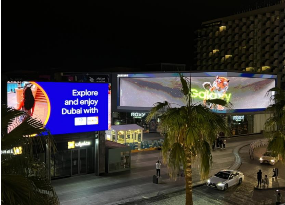
▲在 Galaxy Unpacked 2022 登場前夕，三星於杜拜 The Beach 播放「Tiger in the City」廣告片