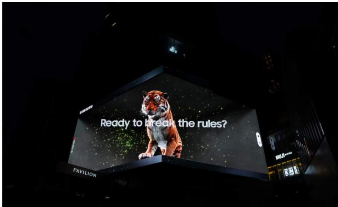
▲在 Galaxy Unpacked 2022 登場前夕，三星於吉隆坡 Pavilion Elite 播放「Tiger in the City」廣告片