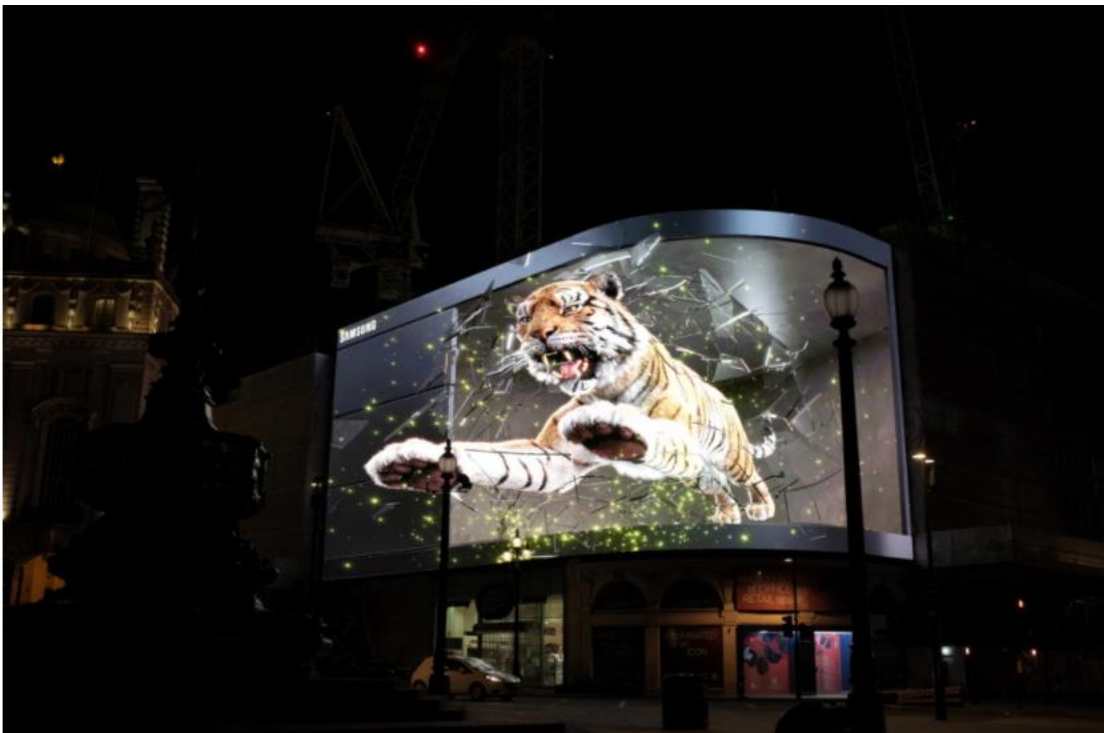
▲ 在 Galaxy Unpacked 2022 登場前夕，三星於倫敦 Piccadilly Circus 廣場播放「Tiger in the City」廣告片