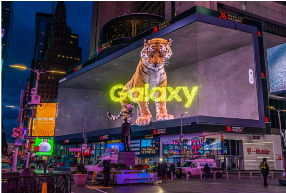
▲ 在 Galaxy Unpacked 2022 登場前夕，三星於紐約時代廣場播放「Tiger in the City」廣告片