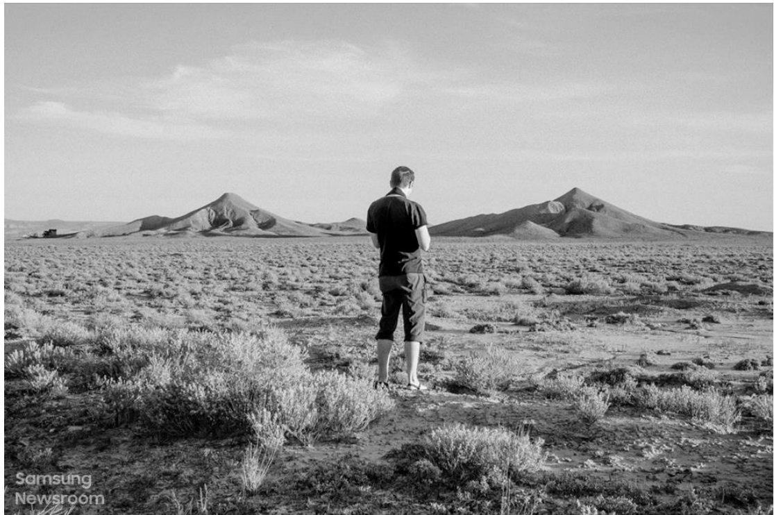
圖 1. 大地即為工作室