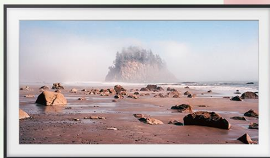
Floating Point 浮點 (2011)