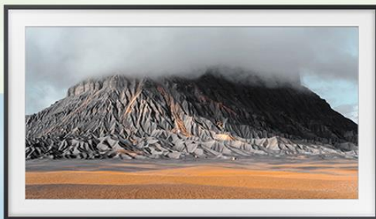
Surfaces 表層 (2016)