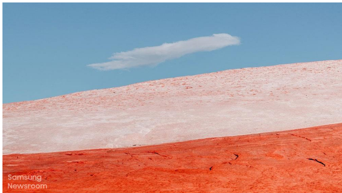
Parallel World 平行世界 ( 2017 )

The Frame 美學電視以奈米級量子點技術呈現 Cobb 的作品；透過 100%色域精準呈現逾百萬種色調，用戶可感受藝術家企圖傳達的色彩、細節與質感，忠實還原作品。用戶亦能體驗地球最原始的美，彷彿親臨現場，感受令人讚嘆的景色。