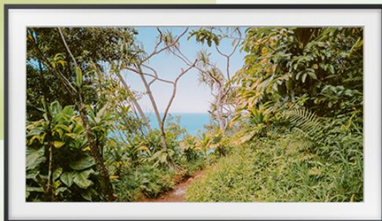
Island 小島 (2011)