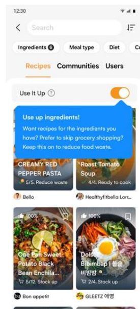
▲ Samsung Food 以用戶 Food List 現有食材搜尋食譜

Samsung Food+ 能依據使用者 Food List 當中的現有食材，制定個人化的飲食計劃，將接近賞味期限的食材優先納入考量，藉以落實惜食愛物的永續目標。借助全新的「Search with Your Food List」功能，使用 Food List 列示食材的食譜，將顯示在搜尋結果的頂端，便於用戶以現有食材發揮廚藝。此外，該服務亦能根據 Food List 提供食譜推薦。Food List 列示的某食材一旦用盡，該項食材將被新增至 Shopping List。此智慧方式有助於高效率的庫存管理、減少食物浪費，確保食材新鮮、美味佳餚上桌。