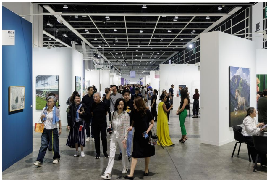
▲ 2024 年巴塞爾藝術展香港展會

展會與香港生機勃勃的藝術界一同發展，雙方不斷相互啟發、相互影響。在我任職期間，香港的文化景觀大幅擴展：新一代收藏家的加入、M+ 與香港故宮文化博物館等世界級機構的開幕，以及商業、非盈利和藝術家空間的蓬勃發展，都為這座城市注入了活力。在香港，我們也推出了多項活動和方案。巴塞爾藝術展香港展會已成為香港藝術社群的基石，本月的展覽也獲得了廣泛認可，我對此深感驕傲。