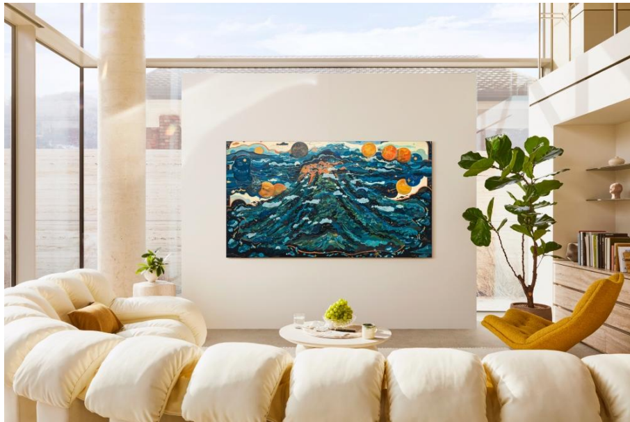
▲ The Frame Pro 展示廖謙衡作品「 Enduring as the universe （天長地久，2024年）」

收藏家的喜好正在改變。人們對新銳藝術家作品的的需求越來越大，對在地藝術家的認可度逐漸提升，他們的個人收藏也不斷增加。此外，隨著年輕收藏家在塑造市場方面發揮更積極的作用，世代改變正在發生中。