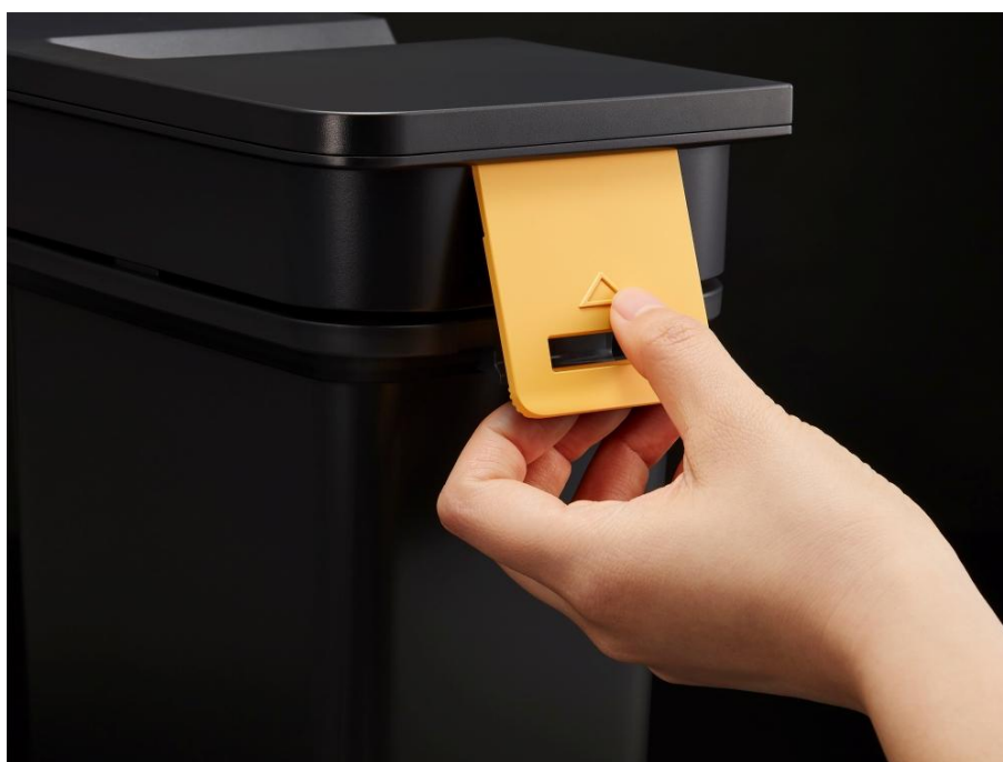
▲ 有凸起輪廓的按鍵讓人們只需觸摸即可輕鬆找到。