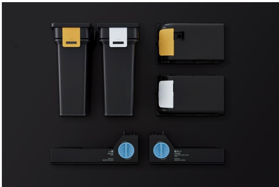
▲ 對水和清潔劑容器的蓋子進行顏色編碼，能一眼輕鬆識別內容物，無須閱讀小圖示。