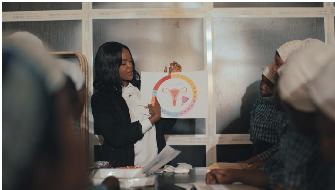
▲ Efe 在工作中強調「目標 1：消除貧窮」、「目標 4：優質教育」和「目標 5：性別平等」，賦權並教育非洲女孩。