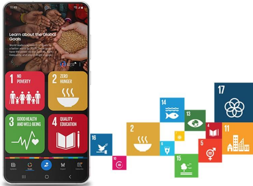
▲ Samsung Global Goals 應用程式讓 Galaxy 用戶能輕鬆合作，共同實踐永續發展目標。

三星與 UNDP 於 2019 年合作推出 Samsung Global Goals 應用程式 (註一) ，Galaxy 用戶可透過該平台了解 17 項全球目標、瀏覽應用程式中的廣告獲得募集資金，並使用桌布增加善款與直接捐款。接著，三星將配對所有廣告收益，讓雙方合作發揮最大效益，支持並以行動力挺 UNDP 推動全球目標。