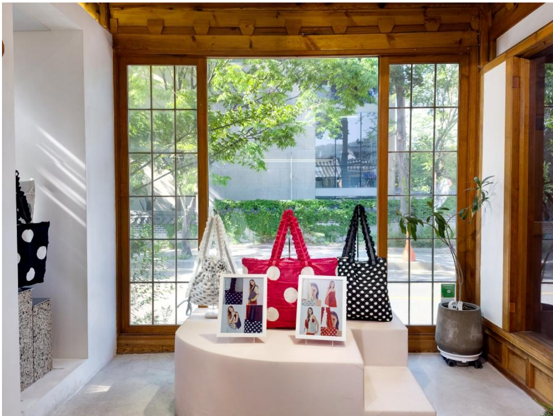
▲ PLEATSMAMA 使用三星彩色電子紙來展示促銷活動與品牌故事。

在首爾的三清洞街區，傳統的韓屋建築與當代的藝廊、咖啡廳及精品店並肩而立。這個融合了文化底蘊與現代創意的街區，也成為 PLEATSMAMA 旗艦店的理想據點，呼應其重視設計美學與永續生活的品牌理念。