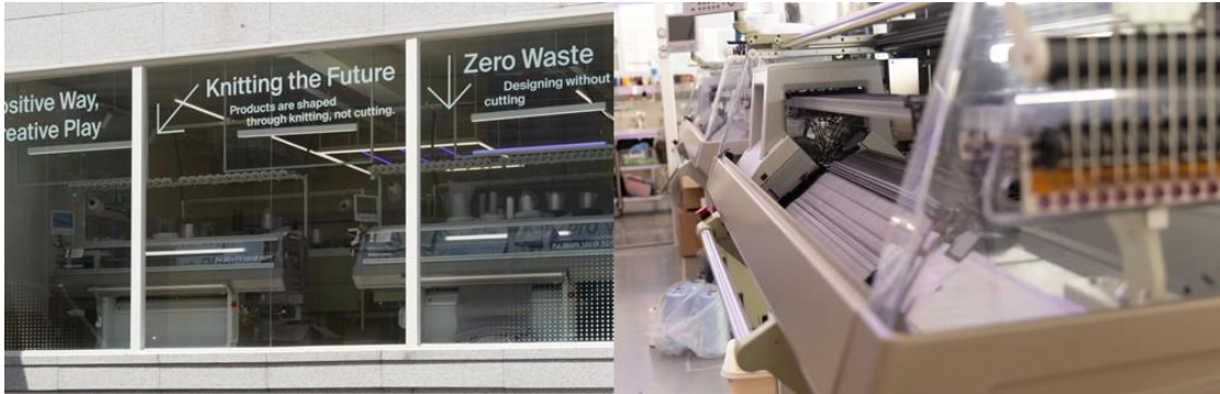
▲ PLEATSMAMA 使用再生紗線與 3D 編織技術來減少布料浪費。

PLEATSMAMA 使用 3D 編織技術製作每款布袋，以極少的剪裁和縫紉大幅減少布料浪費，品牌希望將同樣的思維體現於門市營運中，因為在過去，每當新產品上市和促銷活動推出，店面的紙本文宣就必須頻繁地更換。