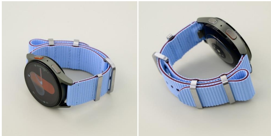
▲「潮流運動錶帶」採用雙固定環設計。

身為 Galaxy Watch 系列的最新成員，「潮流運動錶帶」採用獨特的雙固定環設計，用戶可將過長的錶帶折起、並再次穿過扣環，使其固定到位，確保貼合度與視覺美觀。共推出五款配色供選擇 (註四) ，包括綠色、米白色、粉色、銀色和天藍色，不僅是功能絕佳的貼身配件，亦是宣揚時尚態度的單品。