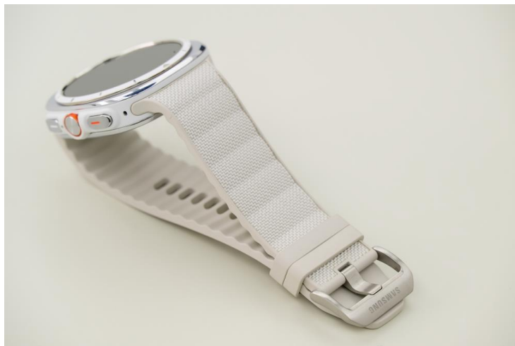
▲「越野運動錶帶」內外採用不同材質，提供最佳實用性