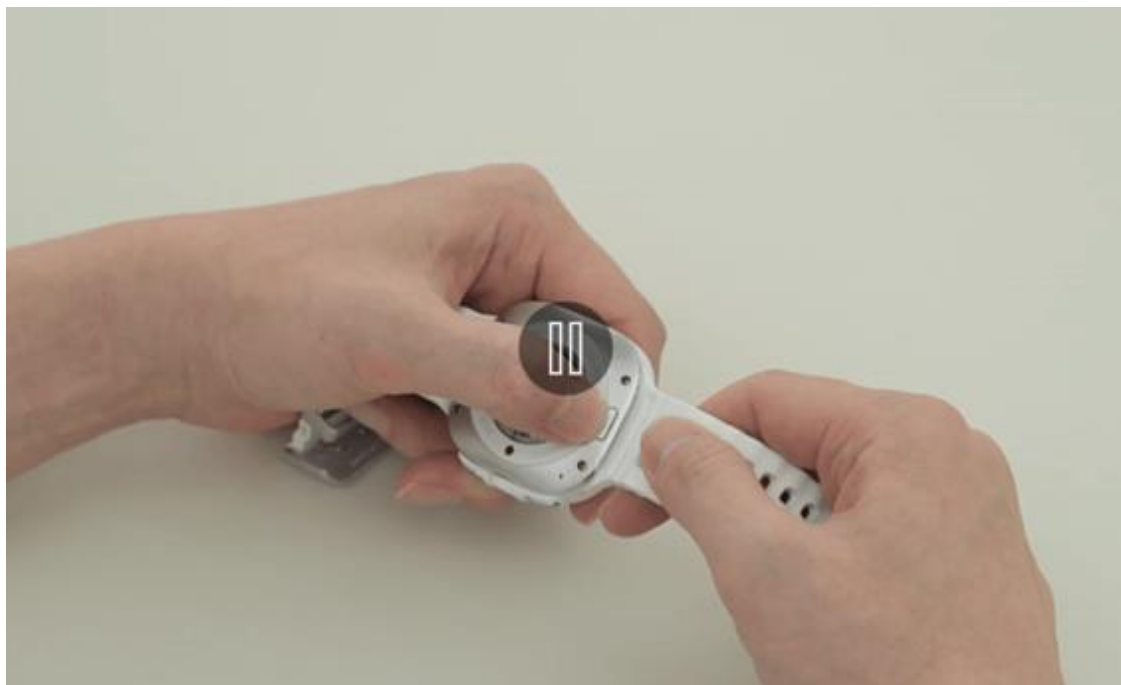
▲ 瞬扣錶帶系統 ( Dynamic Lug System )