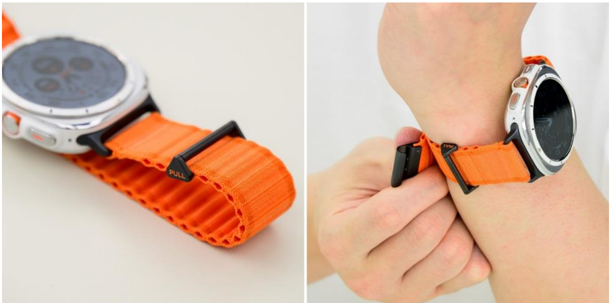
▲（左起）「越野運動錶帶」的三角形鎖扣和掛鉤

「越野運動錶帶」重量約 20 公克，適合跑步、健行和其他活躍型運動。採用舒適的波紋設計，最小化與肌膚的接觸面積，確保即使出汗，亦不減愉悅性。此外，其彈性錶帶可使錶身貼合手腕，更精準地追蹤鍛鍊情形。