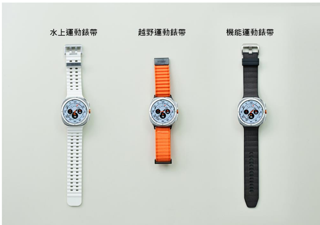
▲ ( 左起 ) Galaxy Watch Ultra 搭配水上運動錶帶、越野運動錶帶以及機能運動錶帶