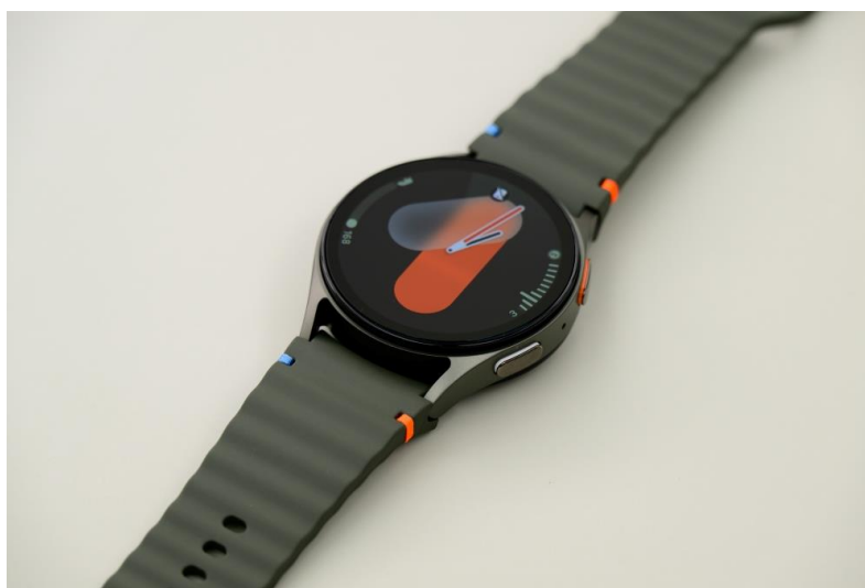
▲ Galaxy Watch7「彈性運動錶帶」的縫線細節

Galaxy Watch7 的「彈性運動錶帶」是從事各類運動和活動的絕佳配件。其以耐用的 HNBR 材質製成，採用透氣、舒適的波紋設計，讓用戶盡情投入體能鍛鍊，享受汗水淋漓的快感。