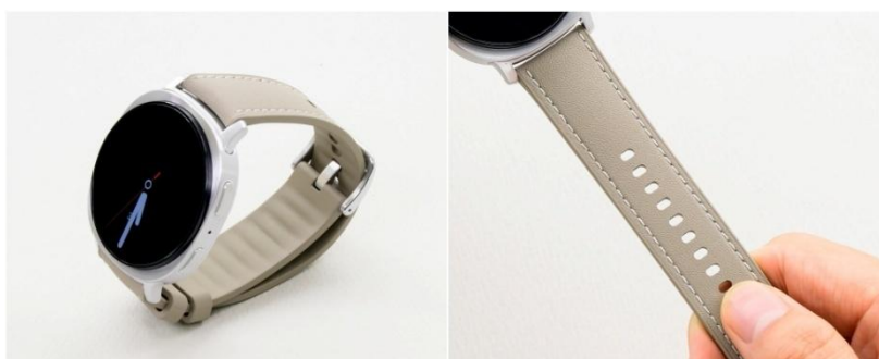
▲防汗皮革錶帶採用雙面材質設計，兼具時尚感與實用性

防汗皮革錶帶結合時尚設計與實用功能，適用於各種場合，是工作與日常生活的完美夥伴。