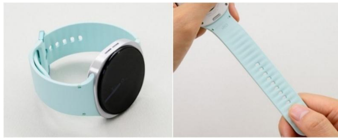
▲ 彈性運動錶帶確保各式運動的輕盈舒適感

彈性運動錶帶是完美的鍛鍊夥伴。其採用柔軟、高彈性的橡膠材質，能牢牢貼合手腕線條，毫無壓力。波紋設計可提升空氣流動，即使在劇烈運動後，依然乾爽不悶熱。