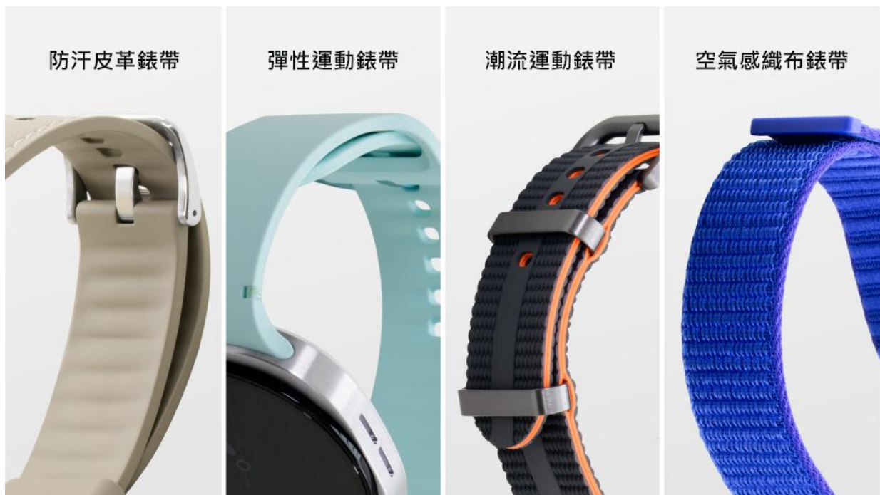
▲ Galaxy Watch8 系列錶帶的樣式陣容

Galaxy Watch8 系列錶帶的更換方式比以往更加簡便，並以一應俱全的樣式選擇，滿足消費者的多元喜好與場合需求。三星新聞中心將透過本篇報導，帶領讀者深入了解 Galaxy Watch8 系列錶帶的功能和魅力（註一）。