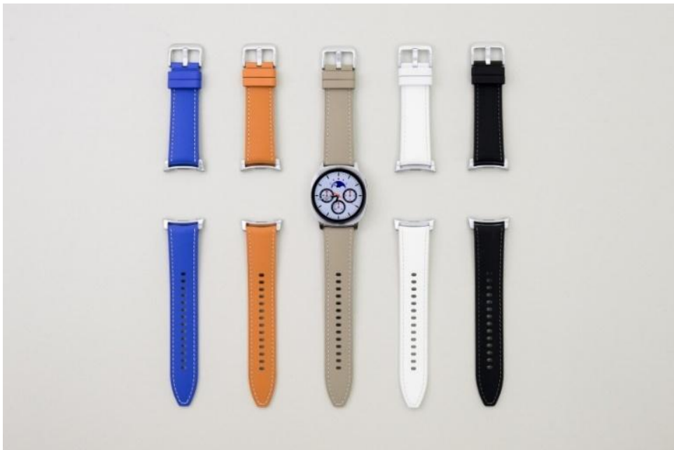
▲ (左起) Galaxy Watch8 系列的防汗皮革錶帶，推出藍色、駝色、灰色、白色和黑色供選擇

縫線設計的細節處理，為整體氛圍增添一抹精緻質感，不僅為休閒服裝畫龍點睛，亦與正式的商務穿搭相得益彰。對於追求百搭各式場合、一錶走天下的消費者而言，防汗皮革錶帶堪稱一項理想選擇。