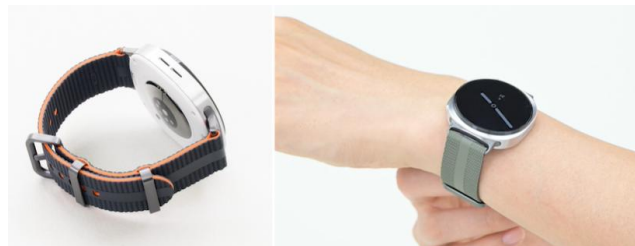
▲潮流運動錶帶融合簡約設計與時尚潮感

對期望活躍與有型兼顧的消費者而言，潮流運動錶帶無疑是最理想的選擇。結合輕盈纖細的設計、別緻的條紋與彩色飾邊，營造現代、時尚前衛的氛圍。