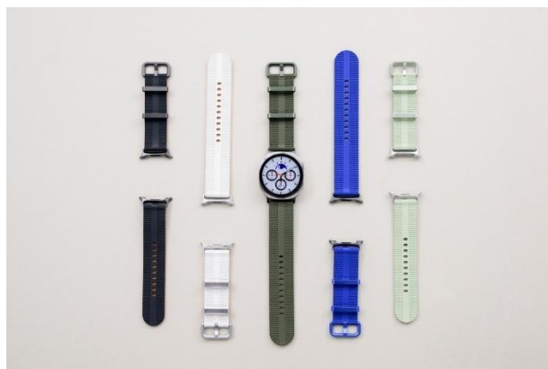
▲（左起）Galaxy Watch8 系列的潮流運動錶帶推出多款配色，包括深灰、白色、綠色、藍色和淺綠

潮流運動錶帶結合鮮明色彩、柔軟舒適的貼合感，從運動休閒到日常穿搭任何場合均可駕馭。用戶可盡情混搭各式服裝，以百變面貌迎接每一天。