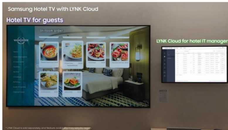
▲ 三星飯店顯示器與 LYNK Cloud

現今住客對客房飯店顯示器的期待，不再僅止於收看頻道，而是希望能輕鬆掌握飯店提供的各項服務資訊、使用館內服務，在住宿期間享受個人喜愛的內容。然而，當住客端內容、服務接觸點與顯示器管理分散於不同系統時，飯店營運團隊往往難以有效整合相關體驗並滿足住客需求。