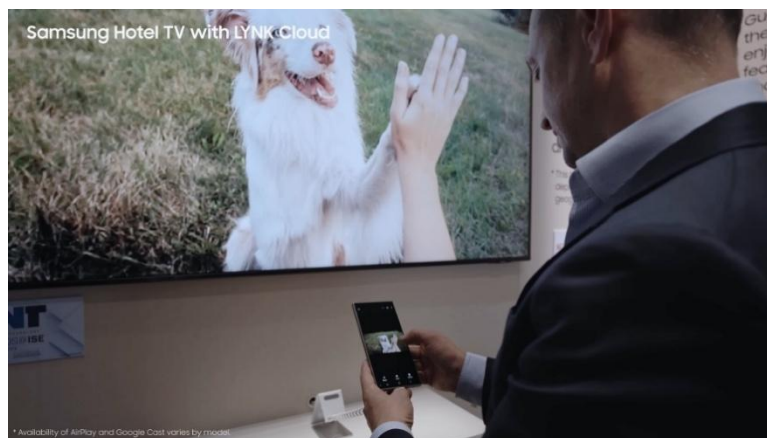
▲ 透過三星最新的飯店顯示器，房客可利用 Google Cast 與 Apple AirPlay 即時串流個人裝置的內容

三星飯店顯示器結合 LYNK Cloud (註一) 飯店雲端管理解決方案，打造整合式客房服務平台，協助飯店串聯住客端內容、館內服務與顯示器管理。透過單一介面，房客可輕鬆瀏覽館內資訊、使用餐飲與服務功能，享受多元娛樂內容，打造更直覺便利的住宿體驗。此外，三星飯店顯示器支援 Google Cast 與 Apple AirPlay (註二) 內容投放功能，讓住客可將個人裝置中的影音內容安全且順暢地投放至客房顯示器，優化客房娛樂體驗。