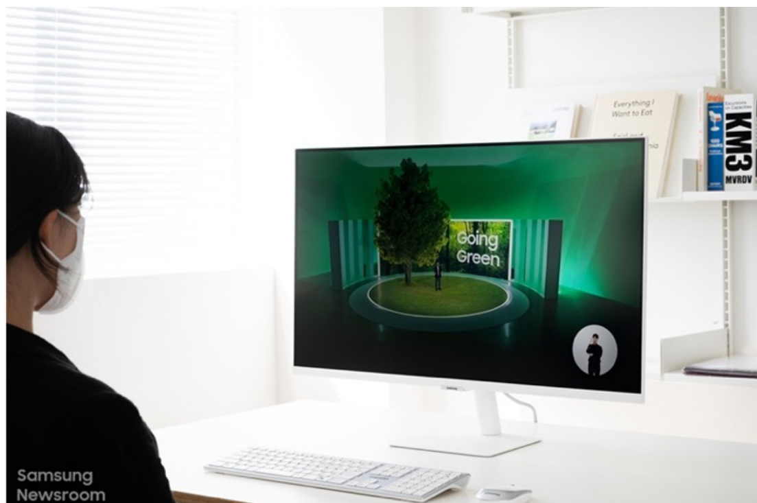
▲ 透過 32 吋 M5 智慧聯網螢幕觀賞高解析度影片

三星智慧聯網螢幕與眾不同；一旦完成初始設定後，便能享受多元的影音內容，完全不需連接電腦或其他裝置。正因三星智慧聯網螢幕皆配備 Tizen 作業系統的智慧中樞，用戶僅需連接 Wi-Fi，即可以令人驚艷的高解析度，輕鬆享受個人喜愛的 OTT 媒體服務 (註一) ，包括 Netflix 和 YouTube。