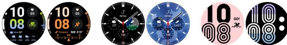
▲ 輕鬆、快速套用最喜愛的錶面

Galaxy Watch 除了是常伴左右的通訊工具，亦具備更豐富的客製錶面，為任何穿搭畫龍點睛。用戶可將喜愛的錶面新增至常用清單，並選擇不同顏色和功能 (註四) ，打造千變萬化的獨特「錶」情。此外，用戶可透過常用清單儲存錶面，供日後快速套用，省去瀏覽所有收藏的不便。