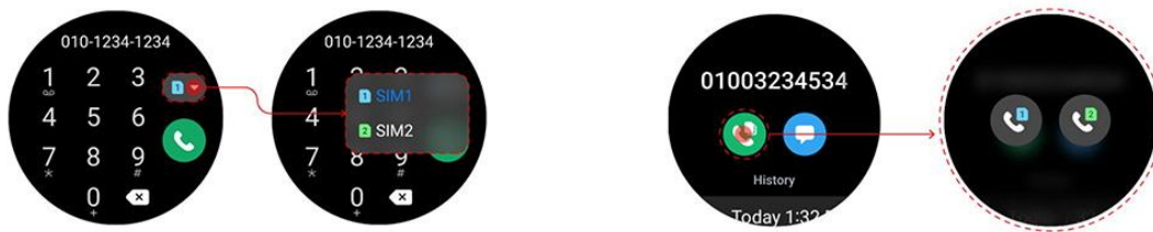
▲ 支援雙 SIM 卡功能，輕鬆撥打電話

Galaxy Watch 除了是常伴左右的通訊工具，亦具備更豐富的客製錶面，為任何穿搭畫龍點睛。用戶可將喜愛的錶面新增至常用清單，並選擇不同顏色和功能 (註四) ，打造千變萬化的獨特「錶」情。此外，用戶可透過常用清單儲存錶面，供日後快速套用，省去瀏覽所有收藏的不便。