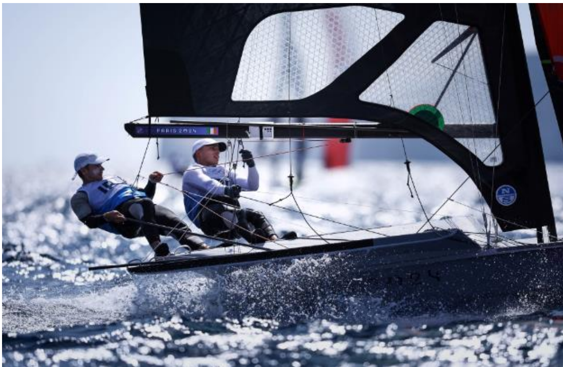
▲2024 巴黎奧運第四天賽事 - 男子雙人小艇 49 人型比賽中，

三星致力為世界各地的運動迷，打造更逼真的沉浸式觀賽體驗，呼應 2024 巴黎奧運力倡的「Games Wide Open」願景。