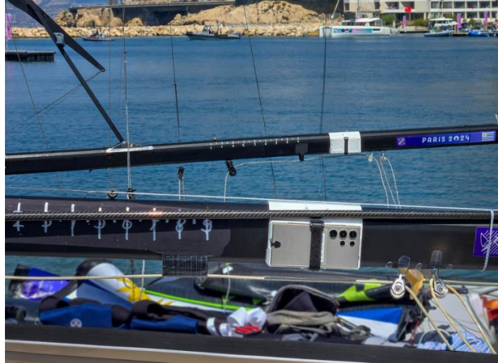
▲ Galaxy S24 Ultra 智慧型手機架設在法國馬賽港舉行的 2024 巴黎奧運帆船賽事中的賽船上。