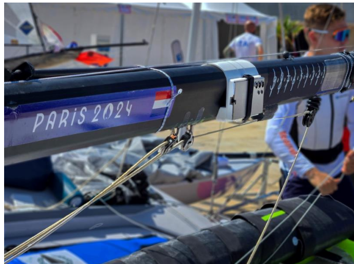
▲ Galaxy S24 Ultra 智慧型手機架設在法國馬賽港舉行的 2024 巴黎奧運帆船賽事中的賽船上。