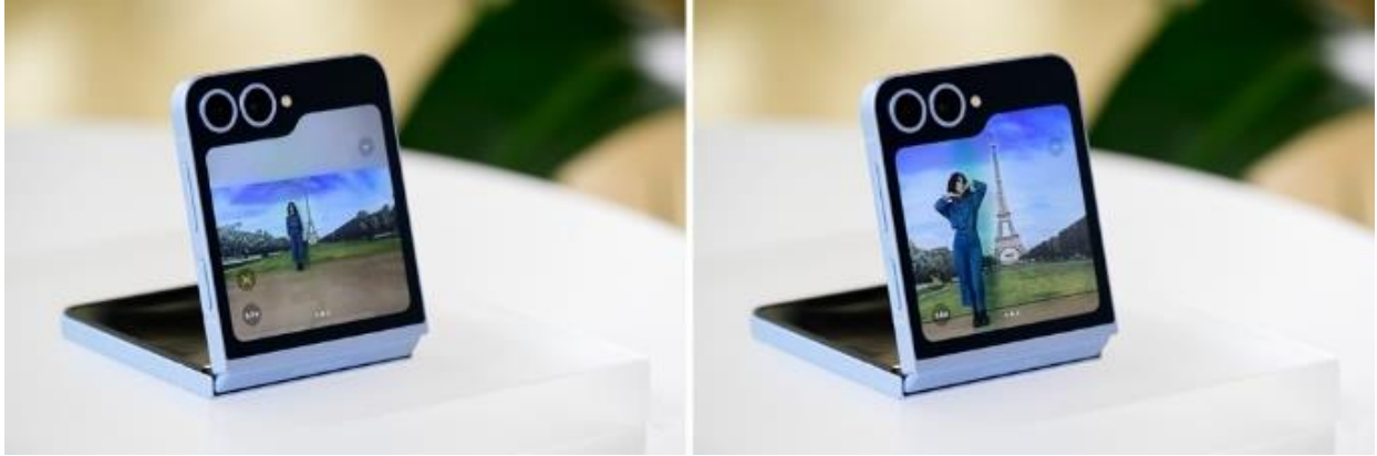
▲ FlexCam 搭載 AI 智慧變焦功能

沒有與艾菲爾鐵塔合照，就不算去過巴黎。然而，一個人旅行時，卻只能以著名景點為背景自拍，或面臨請其它遊客幫忙拍照的困境。