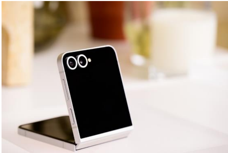
▲ Galaxy Z Flip6 搭載 ProVisual Engine，將攝影體驗提升至嶄新高度

Galaxy Z Flip6 為用戶終結種種煩惱、美拍構圖不求人，在艾菲爾鐵塔前留下完美自拍身影。借助 FlexCam 搭載的 AI 智慧變焦 功能，再也不用忙著調整相機或是衝回鏡頭前就定位。FlexCam 能自動偵測拍攝主體、調整鏡頭遠近，找出最佳構圖，讓使用者從容面對鏡頭，並透過多功能封面螢幕預覽拍攝畫面。