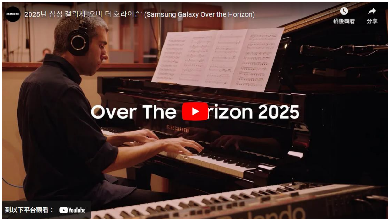
▲ 2025 年《Over the Horizon》音樂影片

每年，三星都會為《Over the Horizon》重新編曲混音，體現其求新求變的品牌精神。2024 年，該主題鈴聲結合韓國傳統音樂「國樂 (Gugak)」，巧妙融合傳統與現代。而 2025 年的全新版本，則以爵士大樂隊演繹的生動節奏，勾勒 One UI 隨時間流逝與日常生活節奏交織的旅程。透過各式樂器交錯的悠揚樂音以及活潑的節奏，鮮活詮釋美好的一天與充滿希望的未來。