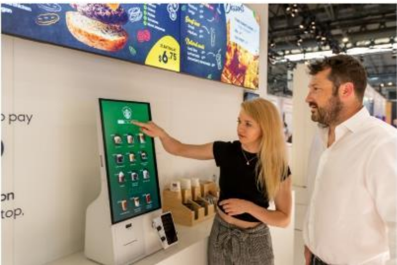
▲ ISE 與會者體驗三星 Kiosk 自助服務機

三星於展會同場加映 Neo QLED 8K 看板，提供更細膩動人的瀏覽體驗。全新升級的逼真感，確保內容的視覺呈現效果，藉由震懾人心的畫面觸動觀賞者的情感，同時準確地傳遞令人印象深刻的品牌形象。對於訴求精湛工藝、臻美細節的精品店家而言（如：頂級珠寶店），堪稱絕佳的商店應用工具。