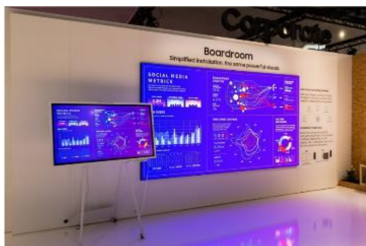
▲ 新型 Samsung Flip Pro 專為各種學習與會議情境，精心設計一系列功能