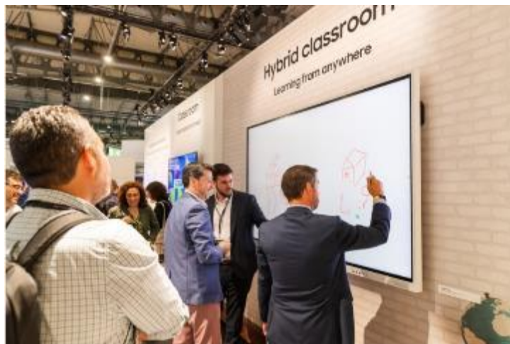
▲ Samsung Flip Pro 的多點觸控功能，支援多達 20 人同時書寫。參展者在 Flip Pro 上書寫筆記，測試觸控螢幕功能