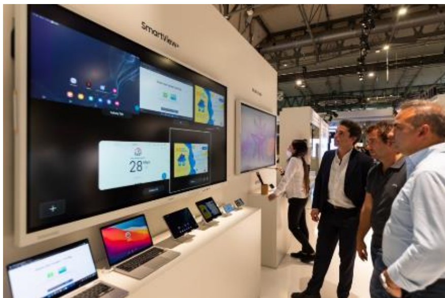
▲ ISE 與會者興致勃勃地探索 Smart View+功能，支援多達六台裝置的螢幕投影

為迎戰會議室與課堂的新紀元，三星在混合用途的設計理念下，推出一項創新解決方案 - Samsung Flip Pro (WMB 系列)，藉由配備的 Smart View+功能，操作人員得於各種作業系統中投射多達六位參與者的畫面。新一代 Samsung Flip Pro 提升用戶體驗，並精心設計一系列功能，使用戶輕鬆駕馭任何學習或會議情境。