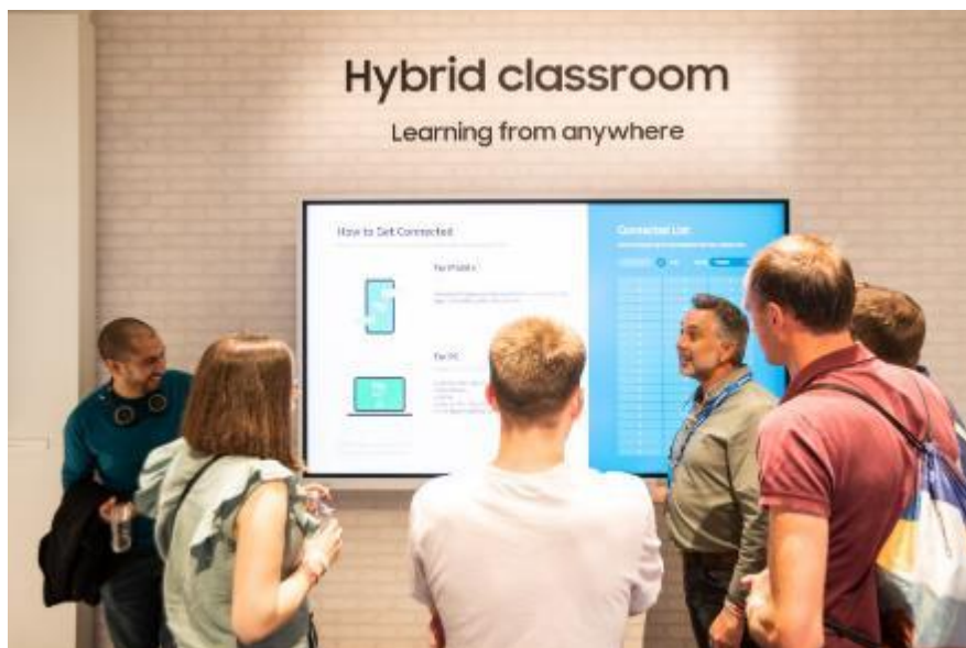
▲ Samsung Flip Pro 具備多項專業功能，適合各種學習或會議情境