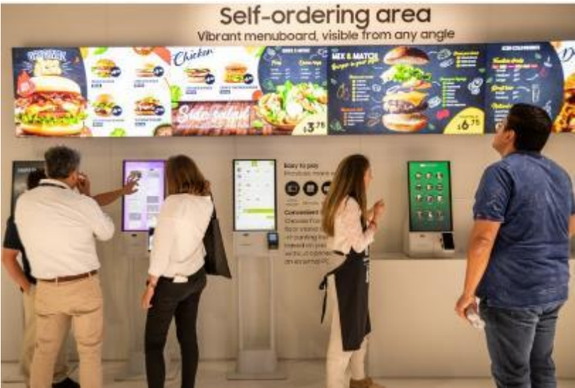
▲ 三星 Kiosk 自助服務機提供一站式解決方案，一次滿足菜單瀏覽、點餐與結帳，且便於安裝，適用於任何商店

三星 Kiosk 自助服務機是另一項前瞻解決方案，在非接觸式顧客互動的時代中，實用性愈顯突出。此項互動式虛擬體驗，為各類空間的商務解決方案打造 360 度零死角視野。