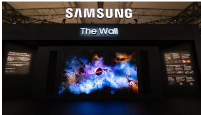
▲ 三星於 ISE 2022 發表 2022 The Wall 新機型 ( 型號 : IWB )