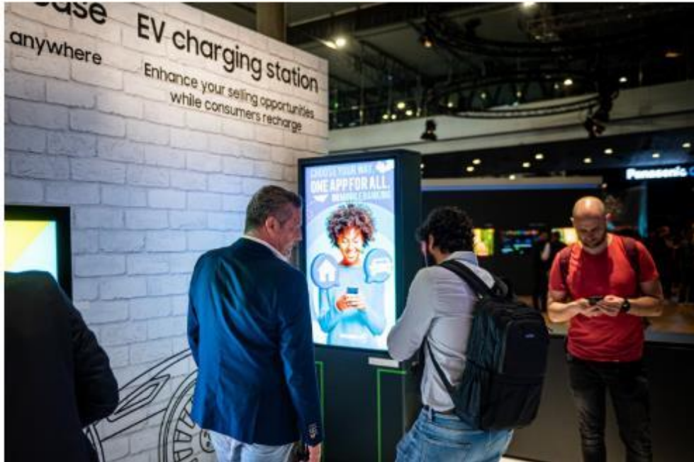
▲ 三星於電動車充電站情境展示戶外看板的應用案例，除了充電統計數據，消費者還能查詢交通狀況、地圖等各類資訊

三星長期深耕戶外看板技術領域、不斷創新突破，從速食餐飲業 ( QSR ) 到電動汽車 ( EV ) 充電站，已將觸角延伸至各行各業。憑藉耐用高效的硬體規格，三星新型 2022 戶外產品陣容 ( OHA 系列 ) 通過 IP56 防護等級認證，能克服各種天氣條件與嚴苛環境；更內建 MagicINFO 雲端管理解決方案，使店家在安全平台 Samsung Knox 的守護下管理顯示器，進一步提升安全與便利性。