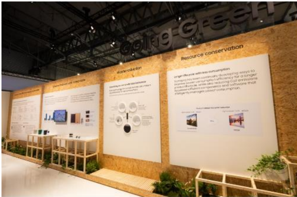
▲ 三星展示如何在新產品的製造過程中，減少對環境造成的衝擊，積極落實「攜手共創明天」( Together for Tomorrow ) 的企業願景