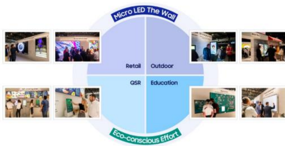
▲ ( 順時針 ) ISE 2022 三星展區綜覽

今年 5 月 10 日至 5 月 13 日間歐洲整合系統展 ( ISE ) 強勢回歸，三星熱情迎接來自世界各地的視聽專業領域人士，揭示最新的創新顯示技術與永續成果。在重塑商業視野 ( Business Reimagined ) 的概念下，三星聚焦多元商業顯示技術和解決方案陣容，展示專為混合應用情境而生的看板技術與雲端管理。讓我們透過下列活動照片，一窺三星新世代看板技術。