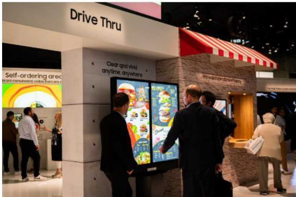
▲ 三星的車來速門市戶外看板，使消費者輕鬆查看菜單與結帳