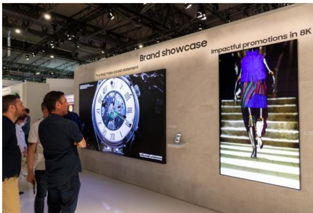
▲ Neo QLED 8K 展現更深邃的暗黑、更極致的亮白，吸引參展者駐足流連