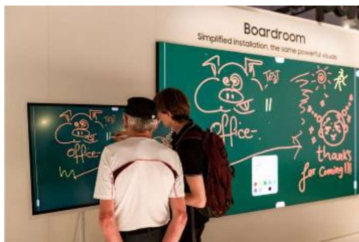
▲ 參展者在串聯 The Wall All-in-One ( 型號名稱：IAB ) 的 Flip Pro 上書寫，測試觸控螢幕功能