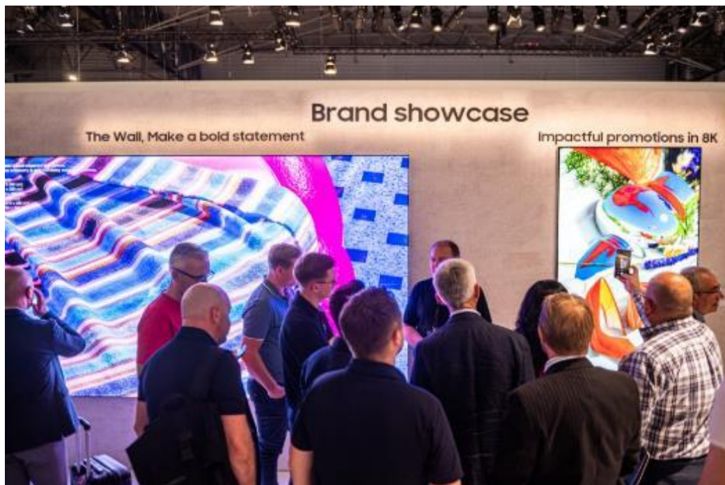
▲ Neo QLED 8K 提供客戶引頸期盼的逼真視覺體驗