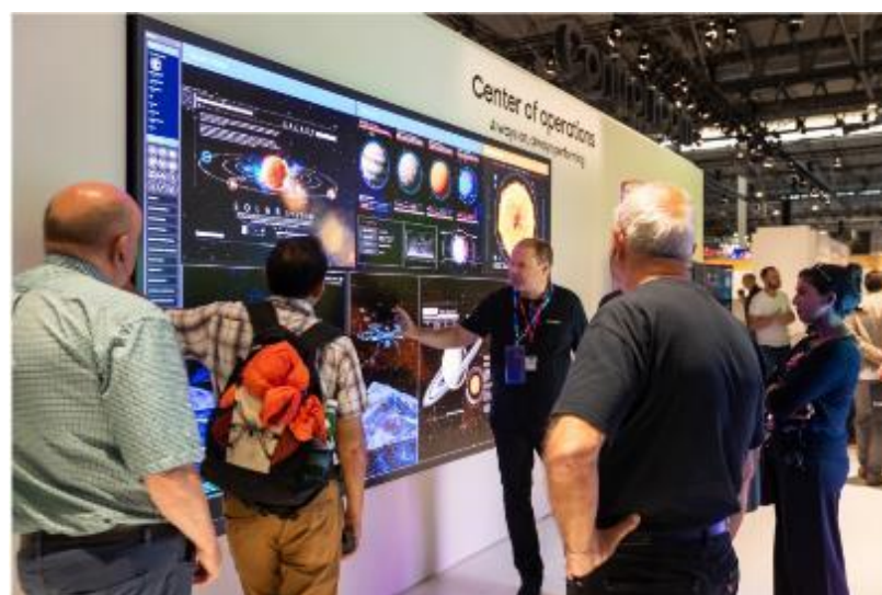
▲ ISE 與會者一睹三星 The Wall ( 型號 : IWA ) 迷人風采