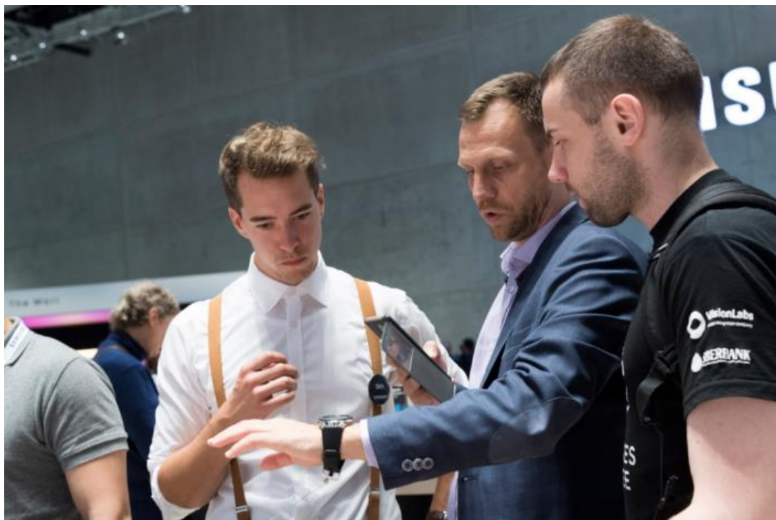
參訪者試戴最新推出的 Galaxy Watch

括三星與 Braloba 聯合操刀設計的 25 款時尚錶帶，讓使用者依個人風格恣意搭配。這些錶帶也同時在三星展位上亮相展示。