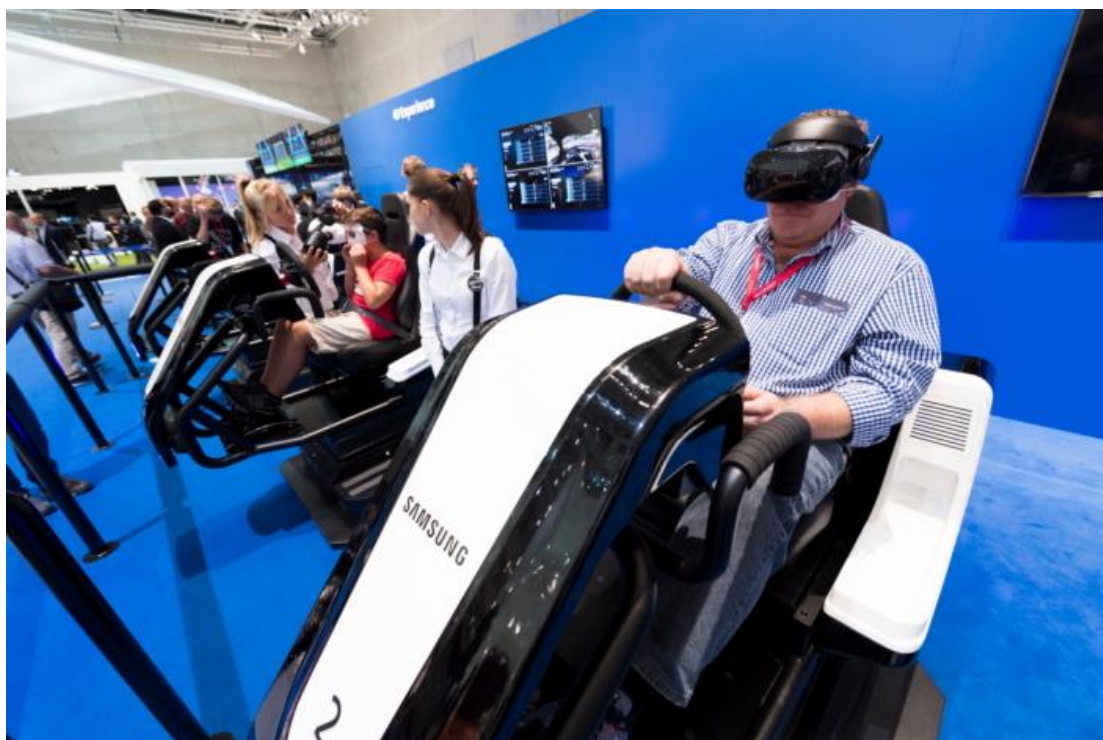
來賓戴上 Samsung HMD Odyssey 頭盔，透過該展區的「Racing VR」VR 模擬器，來一場刺激的騎乘體驗。