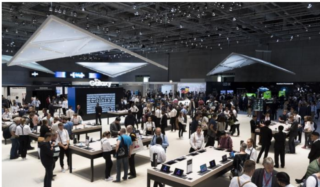
大批 Samsung Town 參訪者簇擁至 Mobile Zone，搶先體驗三星最新的行動創新。