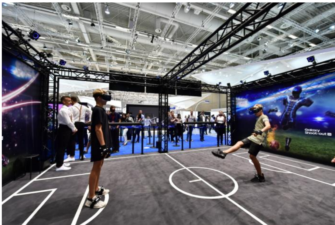
熱情的來賓展開 Galaxy Shoot-out VR 對決 - 這只是 Mobile Zone 眾多趣味活動之一。