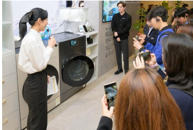
▲ 來賓觀看全方位洗烘衣機 Bespoke AI Laundry Combo™的示範。

Bespoke AI Laundry Combo™一體式設計包辦所有洗烘功能，整合 AI 技術分析用戶需求，藉此推薦最佳洗程。配備 7 吋 LCD 觸控螢幕與 AI 驅動的 Bixby 語音辨識功能，讓便利體驗更上層樓。