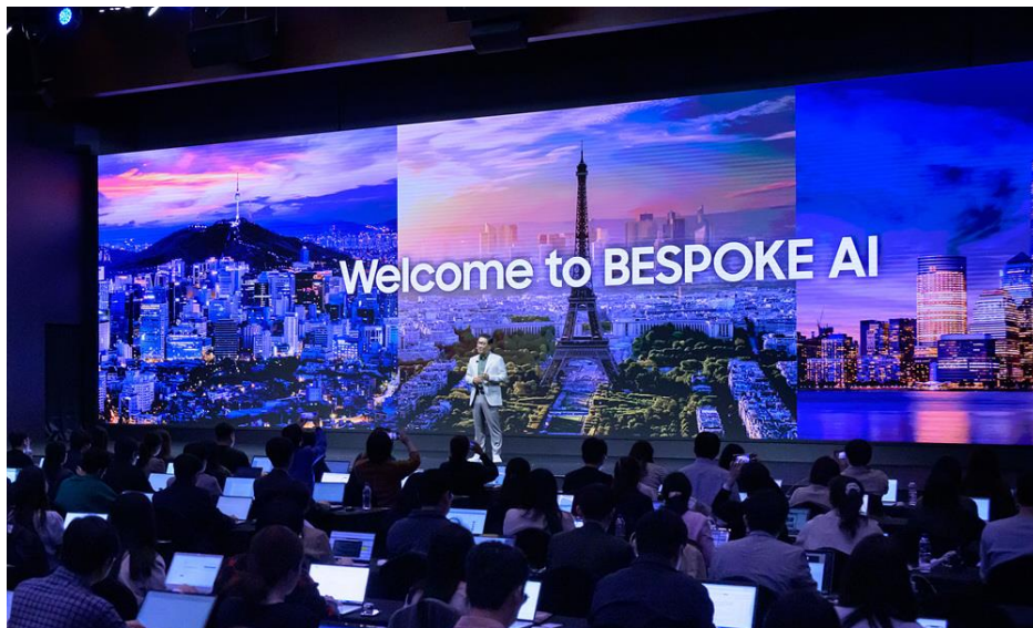
▲ 三星電子副主席暨執行長韓宗熙於「Welcome to BESPOKE AI」進行開幕致詞。

三星電子副主席暨裝置體驗（DX）事業群執行長韓宗熙在開幕致詞中強調 Bespoke AI 體現了「AI for All」的願景 - 透過優化的安全性、永續性和無障礙功能等，改善用戶的日常生活。