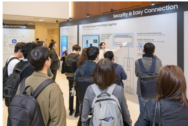
▲ 來賓在安全與簡單串聯區深入了解 SmartThings 功能。

三星在體驗區打造客廳、洗衣間和廚房等再熟悉不過的居家空間，並展示旗下最實用的服務；安全與簡單串聯區則介紹 Smart Forward 如何持續推動裝置升級，以及三星獨家安全標準 Samsung Knox 如何守護用戶的個人資料。此外，來賓在此可探索 Calm Onboarding 如何將產品連結至 SmartThings，大幅簡化每次購入新機時繁瑣的裝置註冊流程。