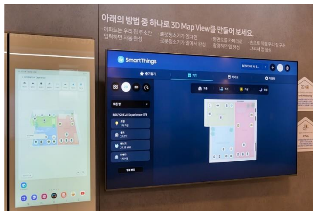
▲ 透過 3D Map View，檢查連結至 SmartThings 的家電位置和狀態。

此外，AI Vision Inside 功能可協助檢查食品包裝上的賞味期限；Samsung Food 則提供使用者客製化的食譜推薦。