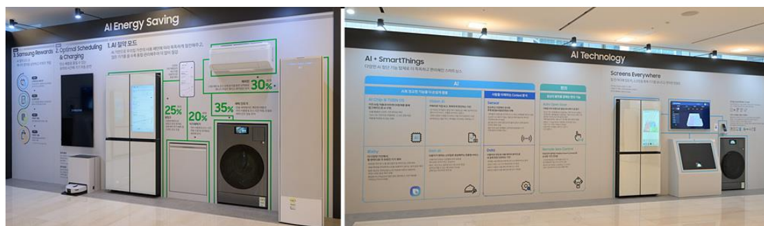
▲ 三星於 AI 節能區與 AI 技術區介紹 AI 節能模式 ( AI Saving Mode ) 和 Samsung Rewards 。

Bespoke Jet Bot Combo™結合吸塵、刷洗地板及蒸汽消毒功能，能夠徹底清潔地板，同時辨別和避開障礙物。用戶還可透過報告查看清潔結果，確認清潔效果是否滿意。