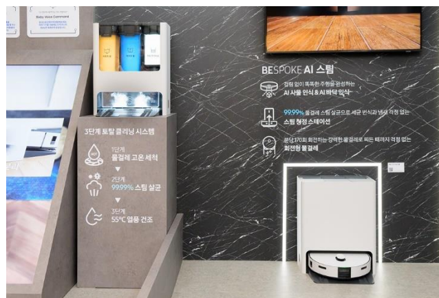
▲ Bespoke Jet Bot Combo™掃拖機器人具備消毒功能。

Bespoke AI Laundry Combo™一體式設計包辦所有洗烘功能，整合 AI 技術分析用戶需求，藉此推薦最佳洗程。配備 7 吋 LCD 觸控螢幕與 AI 驅動的 Bixby 語音辨識功能，讓便利體驗更上層樓。