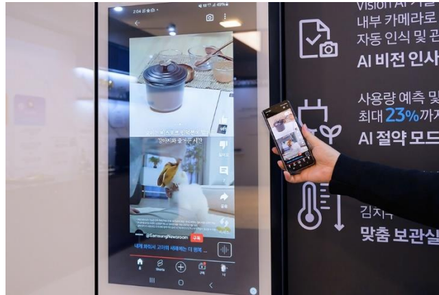
▲ 輕觸智慧型手機上的 Family Hub™，即可在冰箱的顯示螢幕上觀賞影片。

在 Bespoke AI 體驗區中，來賓可親自試用 2024 Bespoke AI 產品，並在內建 AI Family Hub™+ 的 Bespoke 4 門 Flex™冰箱上體驗 Tap View（感應連結）功能。用戶現可藉由輕觸冰箱門投放智慧型手機上的圖片或影片，或從上次中斷的地方接續觀賞電影或電視節目。