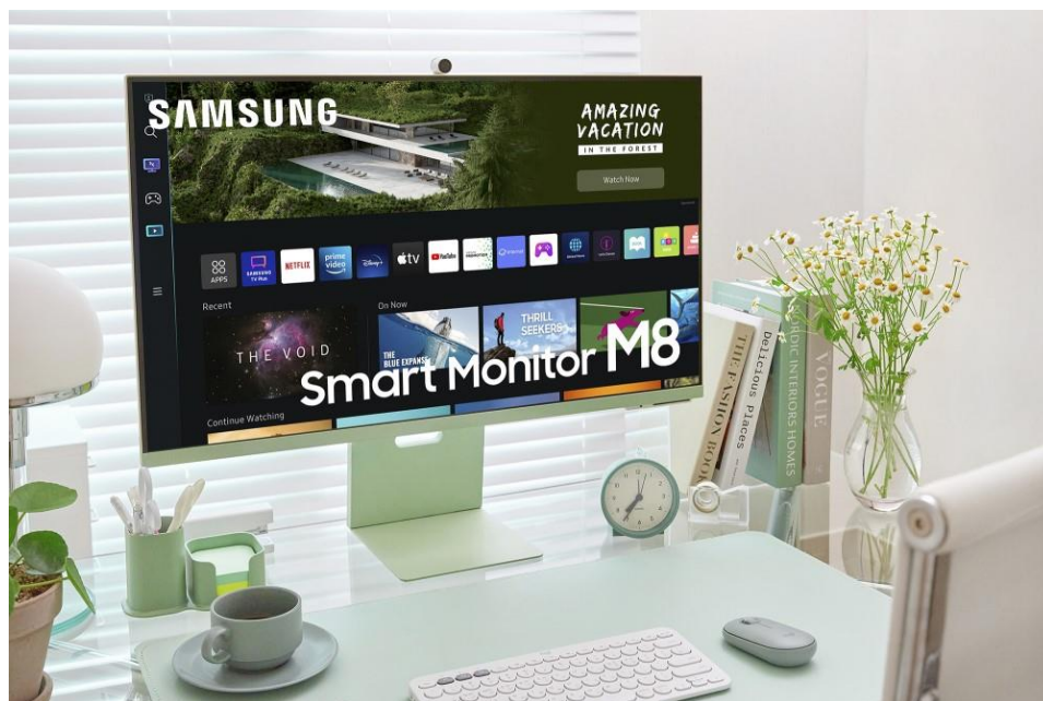
▲ 智慧聯網螢幕 Smart Monitor M8 - 湖水綠

此外，隨著使用電視或智慧聯網螢幕的時間增加，Smart Hub 亦會跨平台及服務，學習用戶的觀看模式與喜好；熟悉之後，智慧推薦符合用戶偏好的新節目選擇，伴隨用戶度過輕鬆愜意的夜晚 (註三) 。