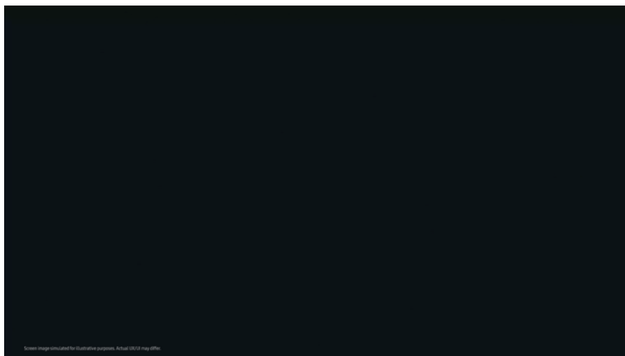
▲ 三星 Tizen OS 讓 AI 智慧顯示器化身個人娛樂中心。

此外，三星 Tizen OS 讓 AI 智慧顯示器不僅能作為娛樂中心，對於獨立策展人而言，此作業系統將根據個人喜好自訂專屬內容，並透過 Samsung Knox 保護其隱私。