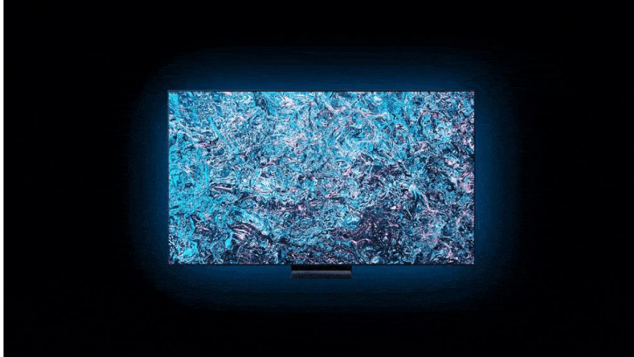
▲ 8K NQ8 AI 第三代高效處理器整合 AI 音效、AI 圖像及 AI 優化功能，實現流暢的觀影體驗。

試想科技讓平凡時刻變得多采多姿、加倍串聯，且更加貼近日常會是什麼情景？三星最新 AI 智慧顯示器 致力提升觀影體驗，並將先進科技無縫地融入至用戶生活。