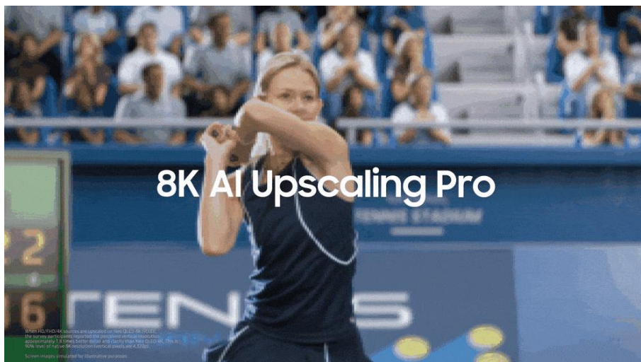
▲ 8K AI 影像升頻 Pro 技術讓用戶更貼近觀影內容。

透過三星 AI 智慧顯示器觀賞網球賽事，用戶彷彿置身球場，每一計發球和截擊都栩栩如生。